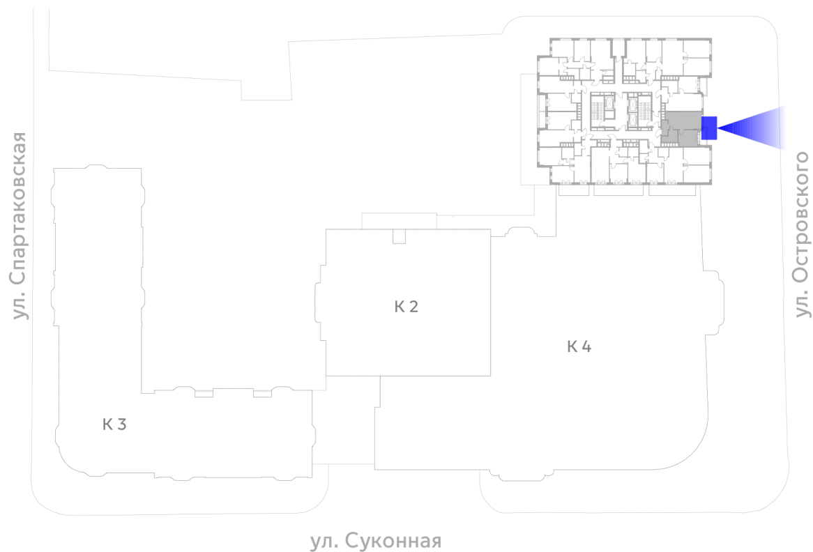
Ориентация лота на генплане комплекса