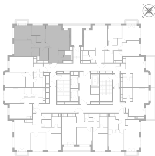
Расположение на этаже — корпус K2, 15 этаж из 22