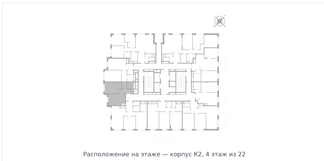
Расположение на этаже — корпус K2, 4 этаж из 22