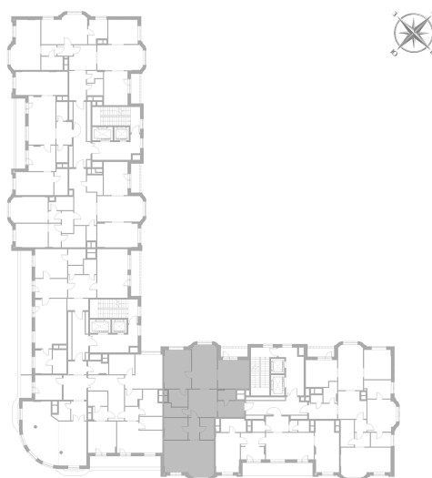
Расположение на этаже — корпус К3, 6 этаж из 9